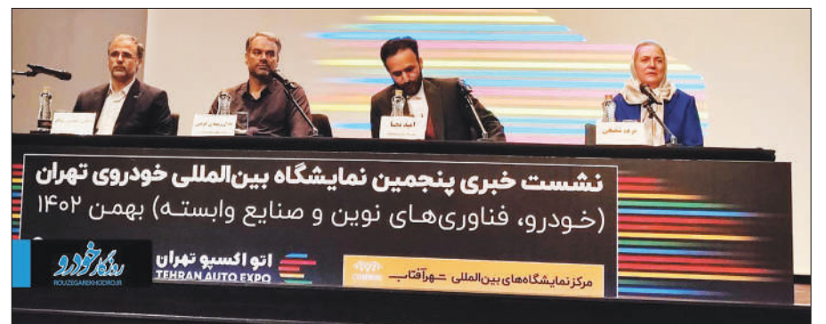
نشست خبری پنجمین نمایشگاه بین المللی خودروی تهران (خودرو، فناوری های نوین و صنایع وابسته) بهمن ۱۴۰۲

مدیرعامل کانون ایران نوین، ضمن اشاره به این نکته که برگزارکننده این دور از نمایشگاه خودرو تهران دغدغه برگزاری نمایشگاه خودرو در سطح جهانی را دارد، اظهار کرد: از دلسوزان این صنعت برای برگزاری نمایشگاه استفاده خواهیم کرد و سعی می کنیم تا در زمینه اجرا متفاوت ظاهر شویم. هدف از این نمایشگاه صرفاً برگزاری یک فروشگاه چندروزه نیست و باید تفاوتی ایجاد کنیم تا مردم بهترین مدل برگزاری