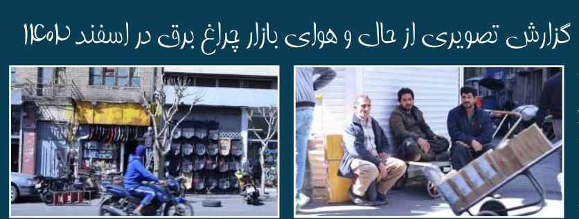
گزارش تصویری از حال و هوای بازار پراغ برق در اسفند ۱۴۰۲