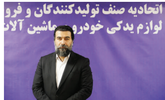
اتحادیه صنف تولیدکنندگان و فروشندگان لوازم یدکی خودرو و ماشین آلات

چالش های بازار اصناف مختلف، در گفت و گو با برخی از این اصناف، در نهایت به دخالت دولت می رسد، که در این زمینه هر کدام انتقاداتی را مطرح می کنند. بخش لوازم یدکی نیز به عنوان بازاری بزرگ از این قاعده مستثنی نیست.